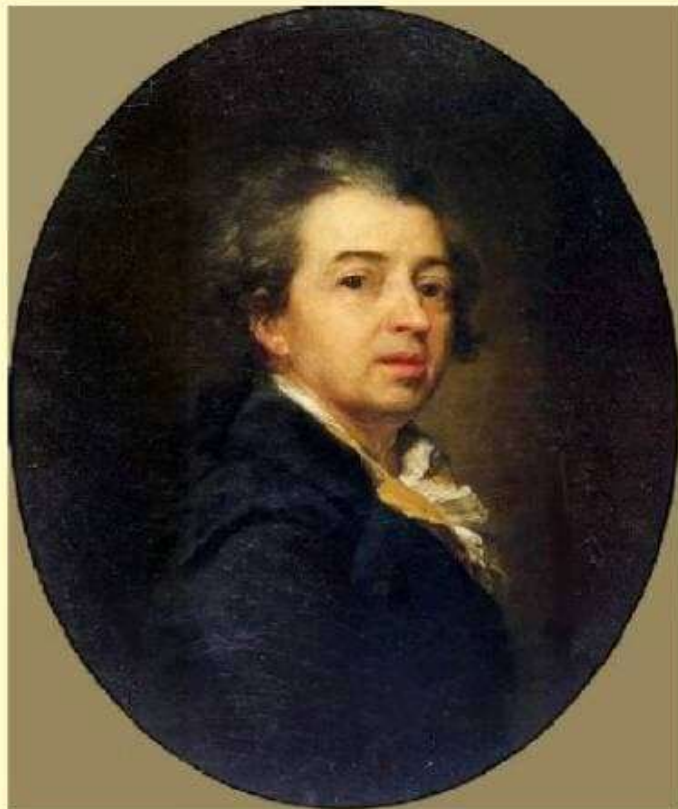
Дмитро Левицький (1735-1822)